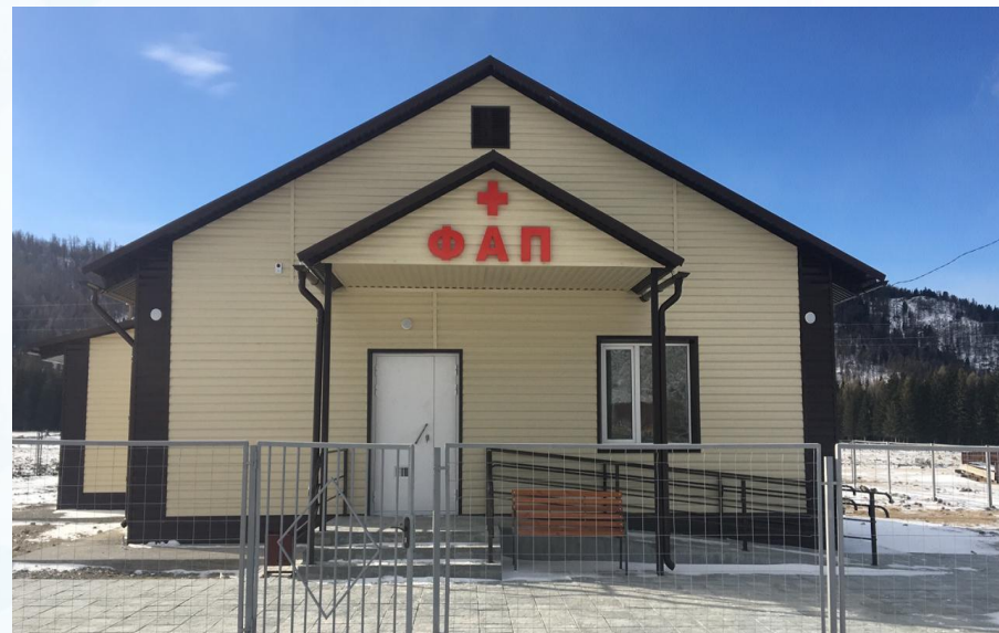
ФАП с.Малая Иня