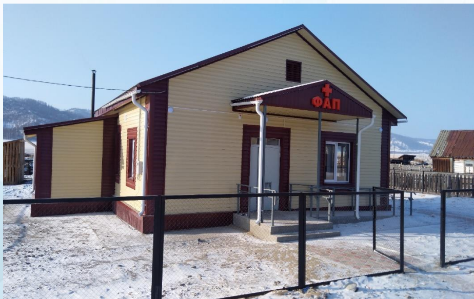
ФАП с. Озерное