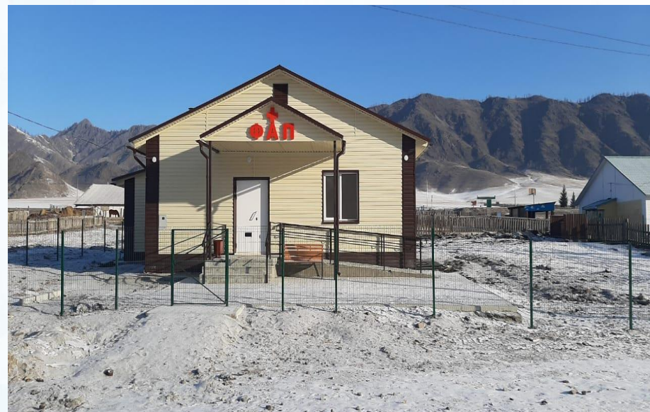
ФАП с. Туекта